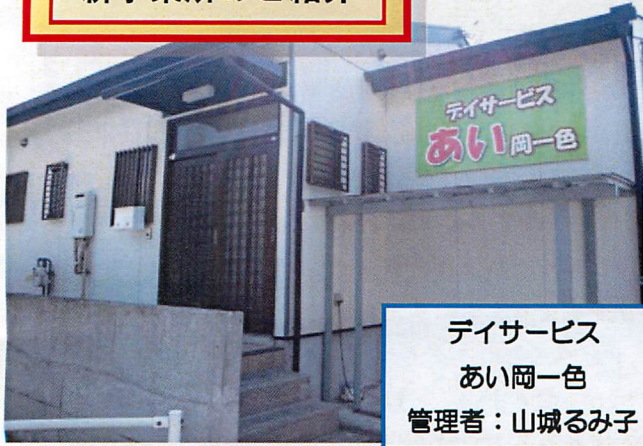
デイサービス あい岡一色 管理者：山城るみ子